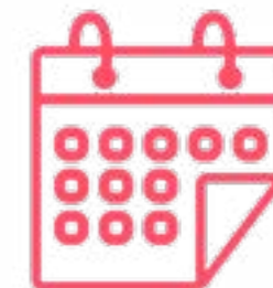
GESTIÓN DE EVENTOS